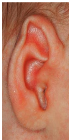
Knik in oorschelp